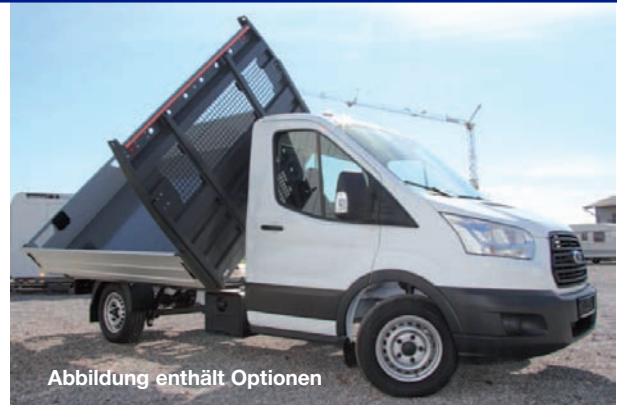
Abbildung enthält Optionen

Umbau eines Fahrgestells zum Dreiseitenkipper auch möglich.